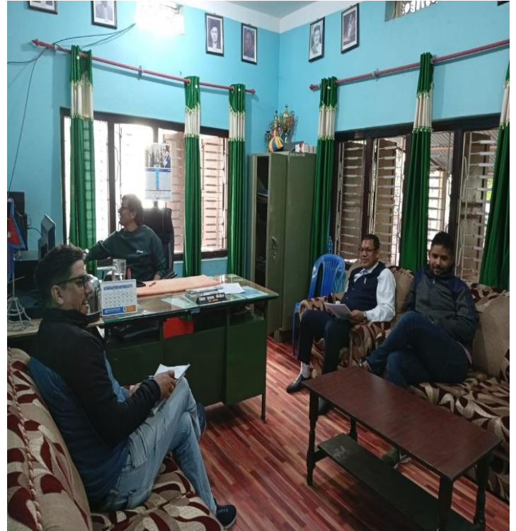
८ नम्बर वडा कार्यालय र वडा कार्यालयमा जनप्रतिनिधि र वडा सचिव ज्यू सँग भएको छलफल कार्यक्रम