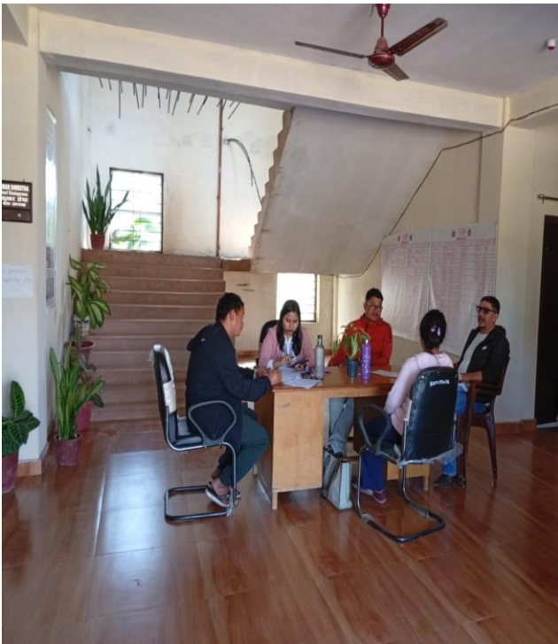
वडा नं. ४ मा वडा अध्यक्ष तथा कर्मचारिविच भएको छलफल