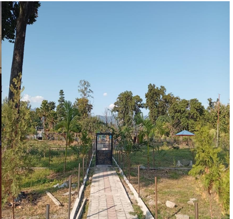
वडा नं. ४ मा वनेको पार्क