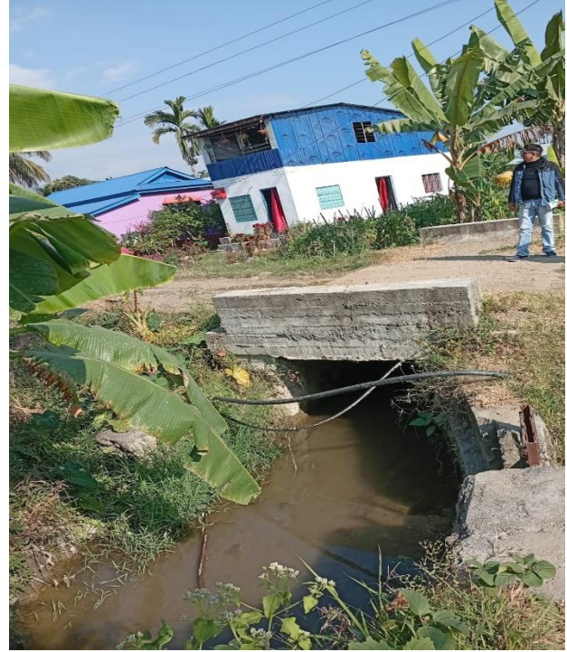
साम्माली पैनी कल्भर्ट निर्माण सम्पन्न वडा नं. ९