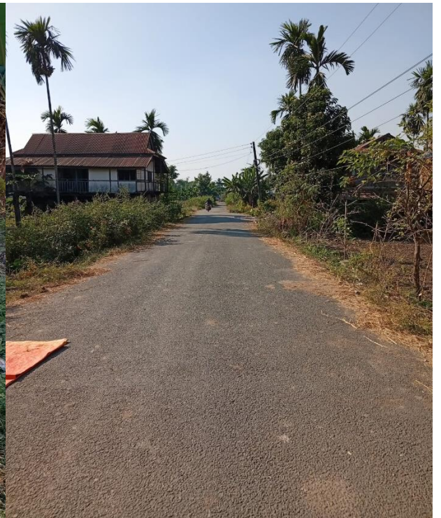
प्रकास मार्ग कालोपत्रे निर्माण वडा नं. ५