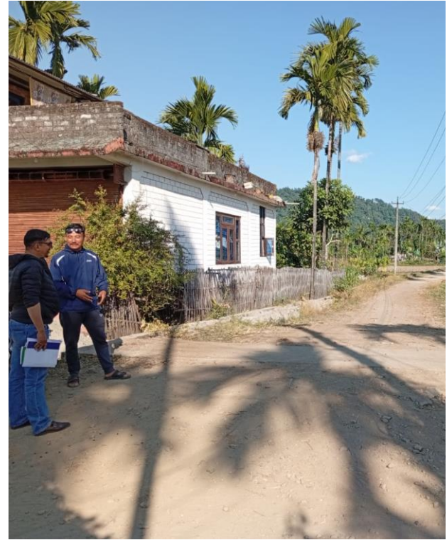
उपभोक्ता समिति मार्फत धनजित गल्लिमा एजिड वाल निर्माण गर्दा निर्माण स्थलमा राखीएको सूचनापाटि वडा नं. ६