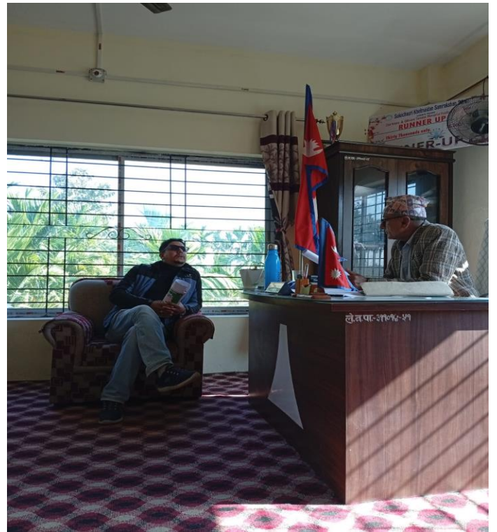
वडा नं. ९ अध्यक्ष तथा वडा सचिव ज्यू सँग छलफलको क्रममा