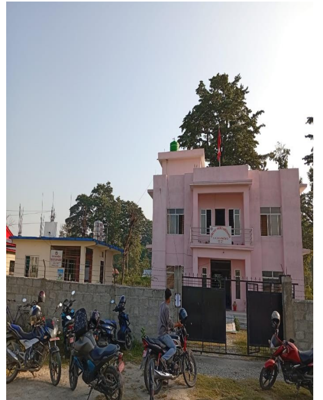
वडा नं. २ को कार्यालय, आधारभुत स्वास्थ्य केन्द्र एवम् कार्यालयमा राखिएको सुझाव पेटिका