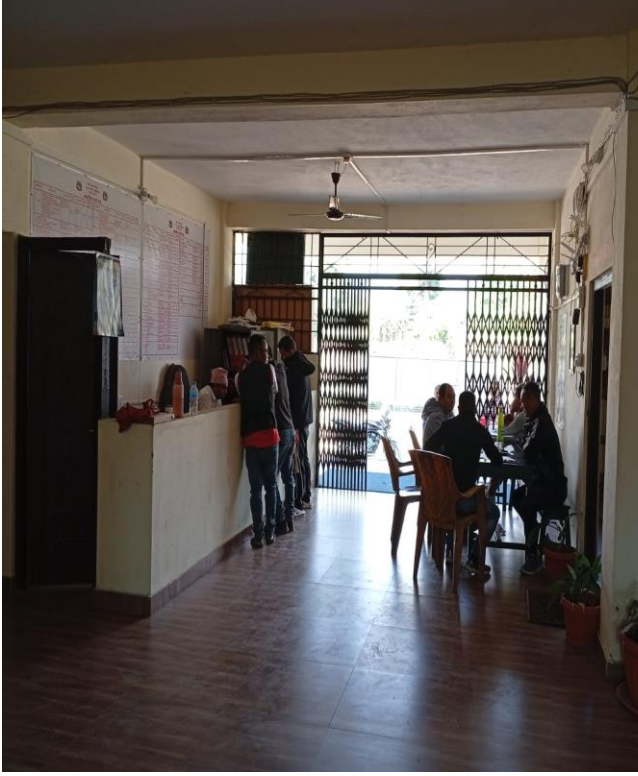
९ नम्बर वडा कार्यालयमा सेवा लिने सेवाग्राही