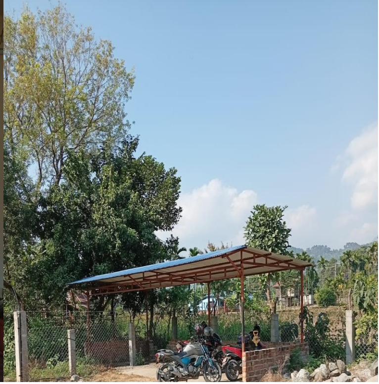
९ नम्बर वडामा निर्माण भएको पार्किङ