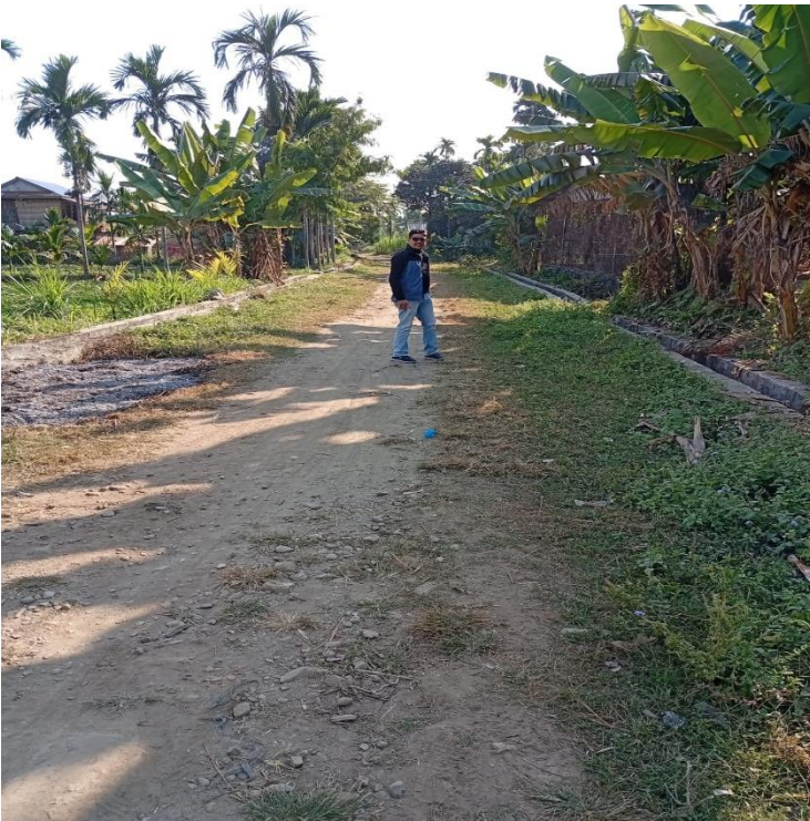
शान्तिमार्ग (एजिड् निर्माण) वडा नं. ५