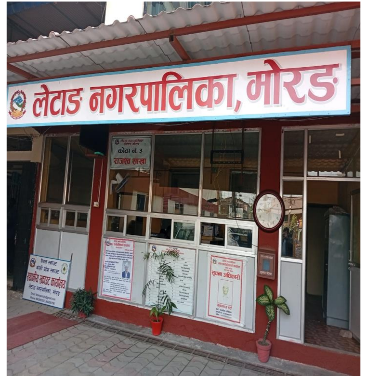
नगरको प्रवेश केन्द्रमा विभिन्न महत्वपूर्ण जानकारी सहितको विवरण ।