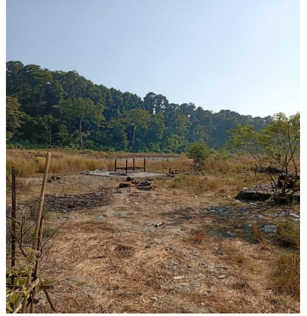
तेलिंगंगा मुक्तीघाट र मलामी बिश्रामघर वडा नं. ८