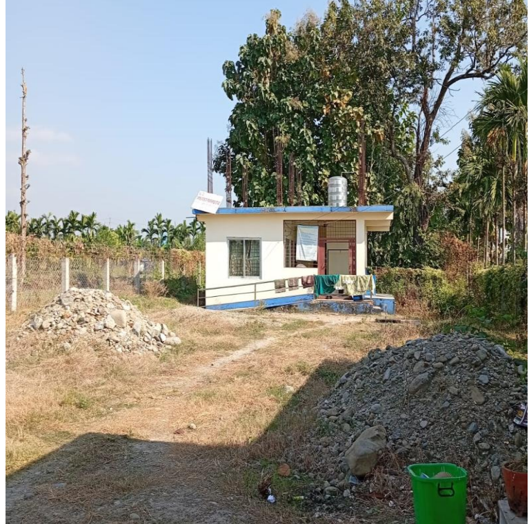
लेटाड नगरपालिका वडा नं. ९ र आधारभूत स्वास्थ्य केन्द्र को कार्यालय भवन