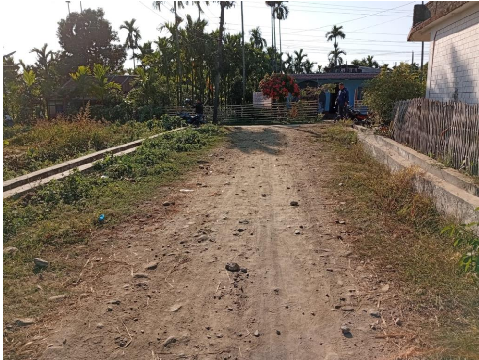
उपभोक्ता समिति मार्फत धनजित गल्लिमा एजिड वाल निर्माण वडा नं. ६ (सूचना बोर्ड देखिने गरी)