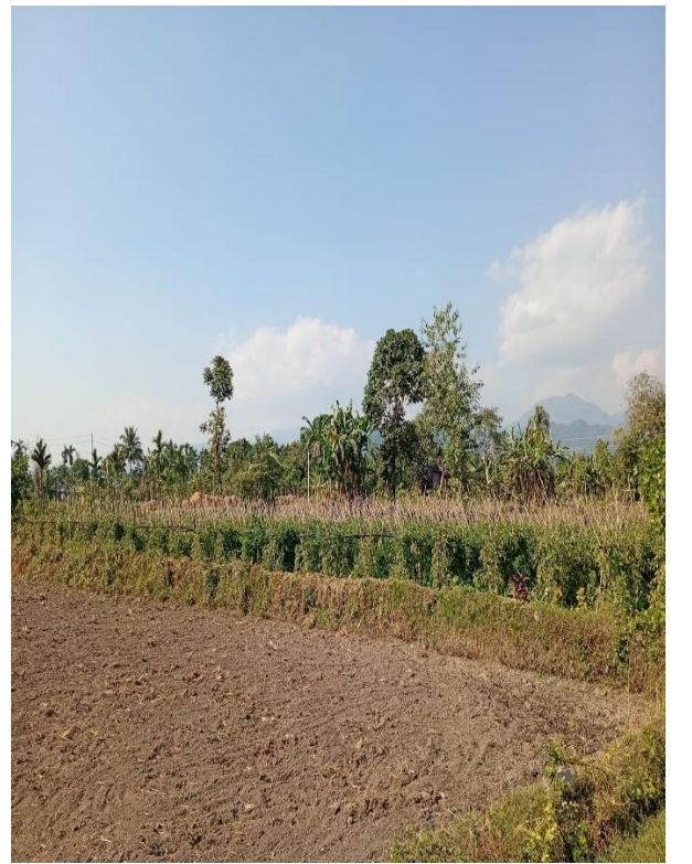
५० प्रतिशत अनुदानमा वितरीत तरकारीको विउ मार्फत किसानको तरकारी खेति