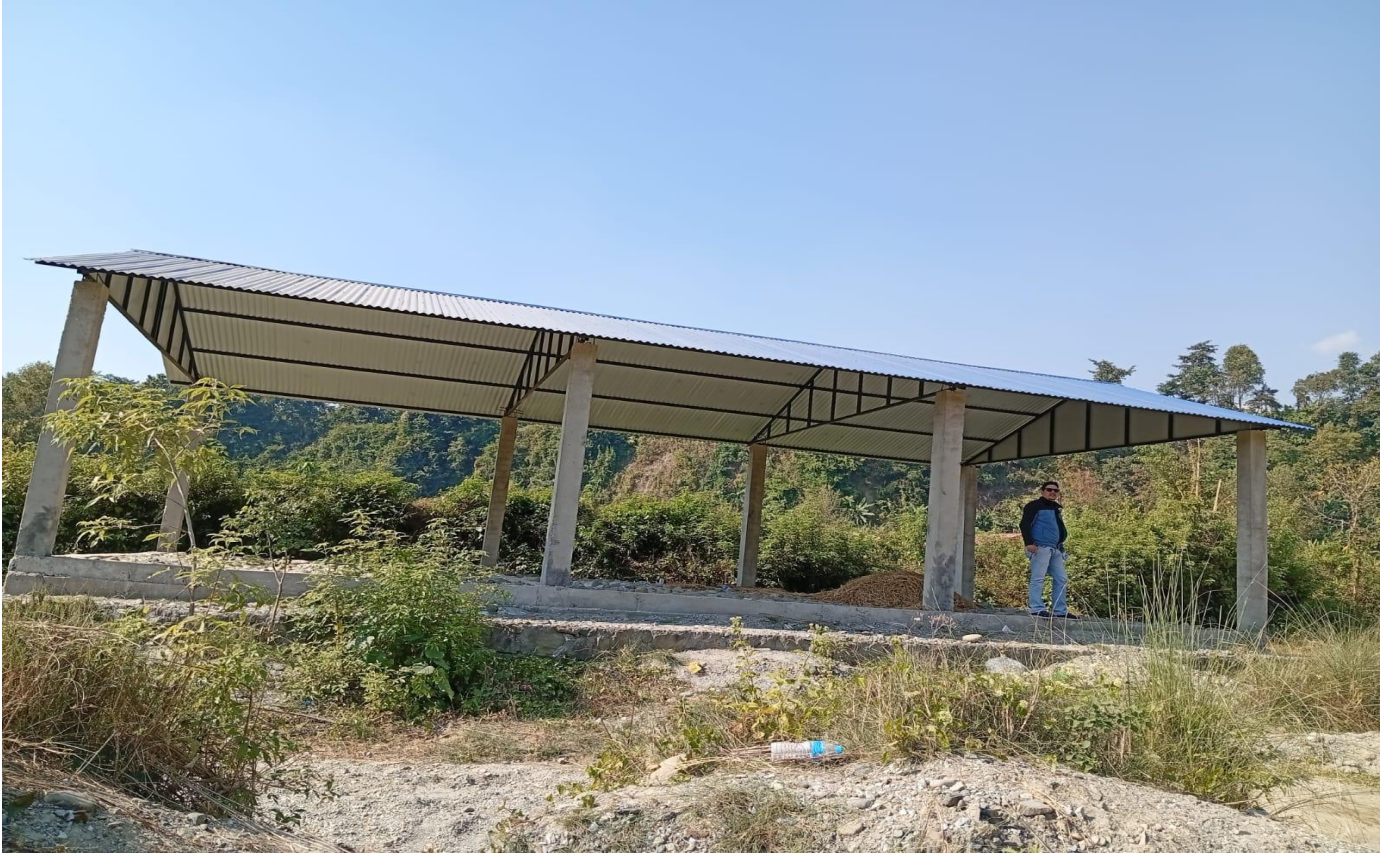
तेलिंगंगा मुक्तीघाटमा निर्माणधीन मलामी बिश्रामघर वडा नं. ८