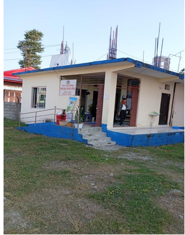
वडा नं. २ को कार्यालय, आधारभुत स्वास्थ्य केन्द्र र उक्त कार्यालय जाने वाटो