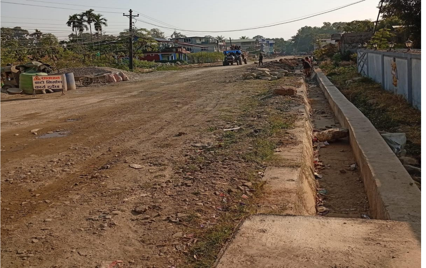
प्रदेश सरकारको सहयोगमा निर्माणधिन कानेपोखरी लेटाड बुधवारे सडकखण्ड वडा नं. ६ कार्यालय अगाडि